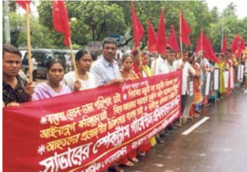
Hier steht ein Bildtext zum Foto. Ich bin ein Blindtext und blind. Hier steht ein Bildtext zum Foto.

bessern. Die beitretenden Unternehmen müssen einen Verhaltenskodex unterzeichnen und die darin festgeschriebenen sozialen Standards einhalten. Oberstes Ziel ist eine nachhaltige Verbesserung der Arbeitsbedingungen.